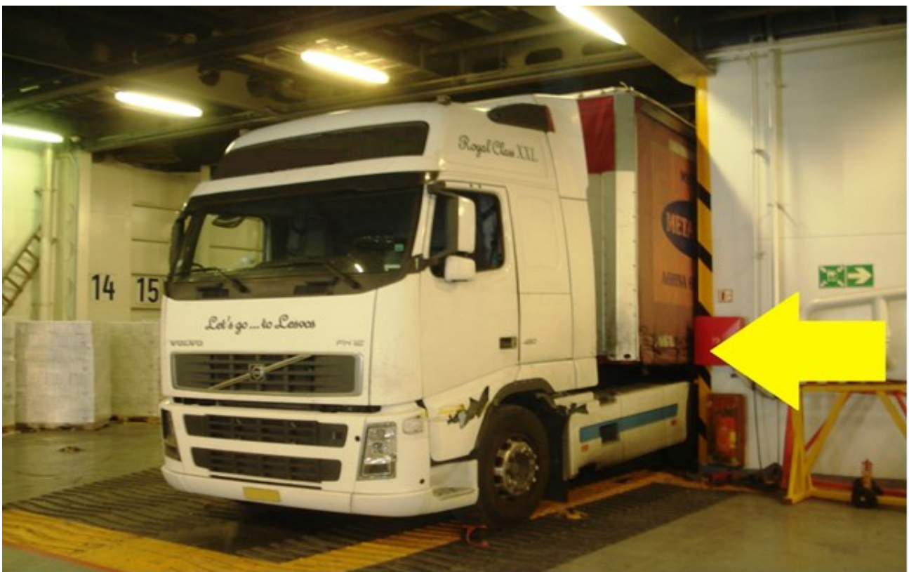
Εικόνα 1 : Το σημείο εγκλωβισμού του οδηγού του Φ/Γ οχήματος

Την 19η Σεπτεμβρίου 2017 και περί ώρα 08:15 π.μ., κατά τη διαδικασία εκφόρτωσης των Φ/Γ οχημάτων στο Ε/Γ-Ο/Γ «Blue Star 1» στο λιμένα του Πειραιά, ένας (01) οδηγός οχήματος τραυματίστηκε θανάσιμα καθώς εξήλθε από την καμπίνα του τράκτορα και εγκλωβίστηκε μεταξύ του ημιρυμουλκούμενου 1 (“επικαθήμενο”) τμήματος του Φ/Γ οχήματός του και του πλευρικού τοιχώματος του χώρου οχημάτων του πλοίου (Εικόνα 1). Το ατύχημα συνέβη καθώς ο οδηγός του Φ/Γ οχήματος δεν είχε ασφαλίσει το χειρόφρενο του οχήματός του, προτού εξέλθει από αυτό για να πραγματοποιήσει τη ζεύξη (σύνδεση) μεταξύ του ρυμουλκού και του επικαθήμενου προκειμένου εν συνεχεία να εξέλθει από το πλοίο.