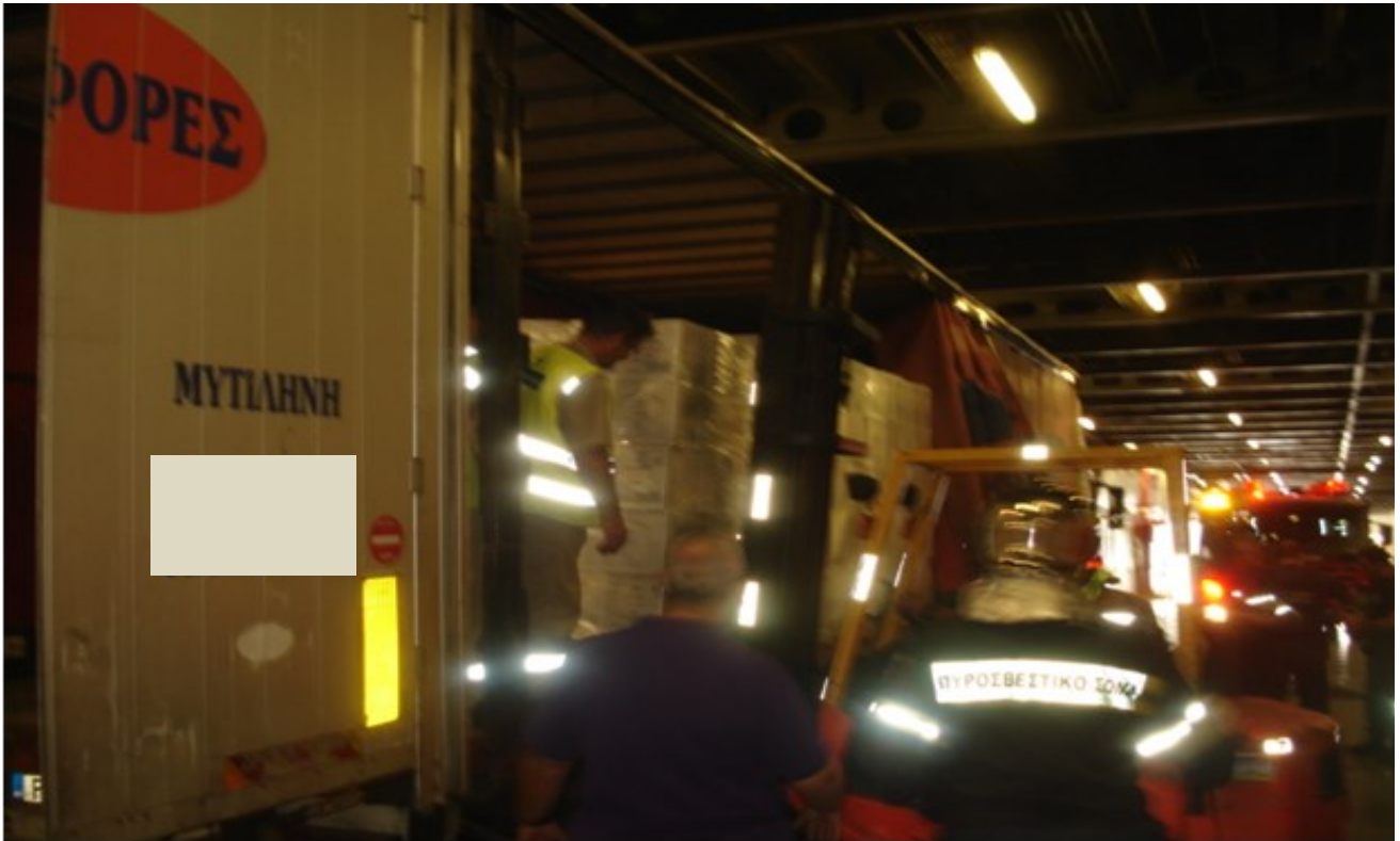
Εικόνα 4: Φωτογραφία από τη διαδικασία απεγκλωβισμού

Ε.Κ.Α.Β.. Περί ώρα 09:25 π.μ. ο οδηγός απεγκλωβίστηκε από τον χώρο του ατυχήματος με τη συνδρομή μελών του πληρώματος, του ιδιοκτήτη του Φ/Γ οχήματος καθώς και της Πυροσβεστικής Υπηρεσίας (εικόνα 4). Με ασθενοφόρο του Ε.Κ.Α.Β., ο οδηγός μεταφέρθηκε στο Γ.Ν. Πειραιά «Τζάνειο», όπου διαπιστώθηκε ο θάνατός του.