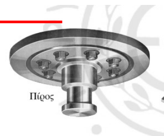
Εικόνα 5: Ο πύρος έλξης του ημιρυμουλκούμενου