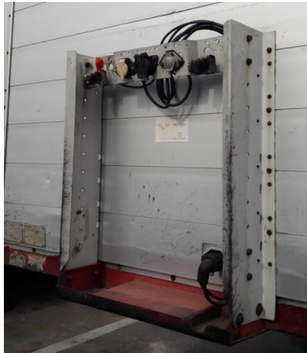
Εικόνα 8: Πλατφόρμα ζεύξης επικαθήμενου με τους υποδοχείς καλωδίων τροφοδοσίας ρεύματος και αέρα

Σημειώνεται ότι, το σύστημα πέδησης του επικαθήμενου (σύστημα φρένων) είναι υδραυλικό-πνευματικό και όταν δεν είναι συνδεδεμένο με το ρυμουλκό οι τροχοί του δεν μπορούν να κινηθούν. Αυτό συμβαίνει επειδή η πίεση του αέρα είναι απαραίτητη για την απελευθέρωση των φρένων.