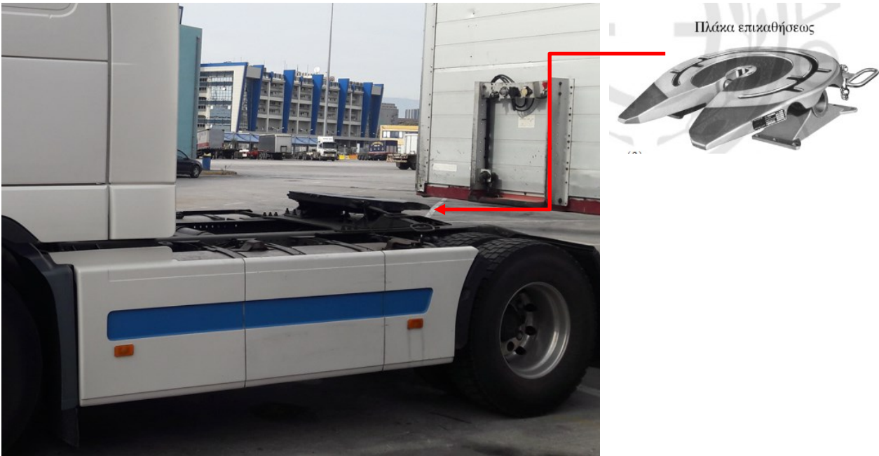
Εικόνα 6: Η πλάκα επικαθήσεως του ρυμουλκού