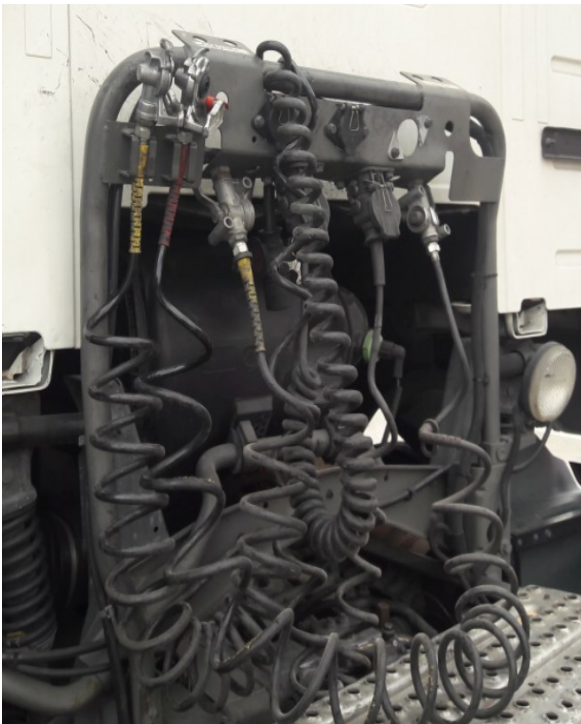
Εικόνα 7: Πλατφόρμα ζεύξης τράκτορα με τα καλώδια τροφοδοσίας ρεύματος και παροχής αέρα στο ρυμουλκούμενο