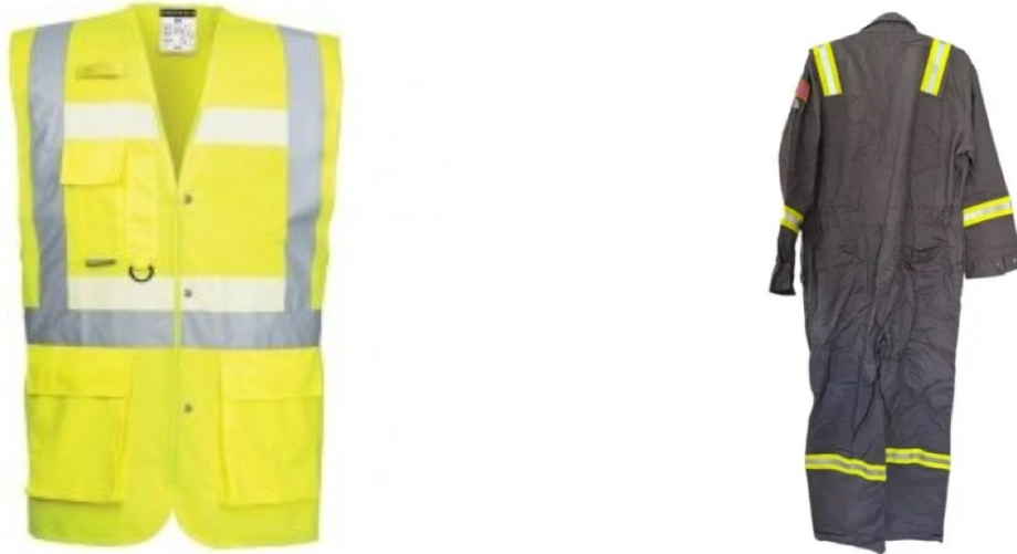
Εικόνα 13: Φθορίζον γιλέκο με ανακλαστικές ταινίες και φόρμα εργασίας με ανακλαστικές ταινίες

δυνατότητα εντοπισμού των ατόμων που τα χρησιμοποιούν. Τα εν λόγω γιλέκα δέον να φέρουν πιστοποίηση που να εξασφαλίζει την αντοχή τους σε περιβάλλον θαλάσσης και να είναι εύκολα αναγνωρίσιμα.