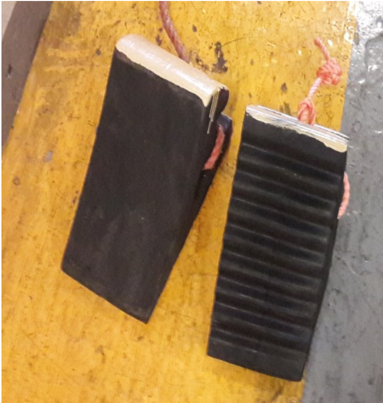
Εικόνα 12: Σφήνες αναστολής κύλισης (τάκοι) Φ/Γ οχημάτων

Σε σχέση με τα ανωτέρω, στο άρθρο 14 του Γ.Κ.Λ. αριθ. 14, περιγράφονται οι απαιτούμενες διαδικασίες για την ασφαλή τοποθέτηση, στερέωση και έχμαση των οχημάτων και μεταξύ άλλων, στην παράγραφο 4 αναφέρεται ότι: