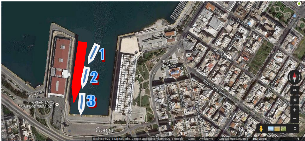
Εικόνα 1: Άποψη της περιοχής της προβλήτας Νο 3 (Ακτή Ξαβέρη) στον Κεντρικό Λιμένα Πειραιά. Έχουν απεικονιστεί σκαριφηματικά (χωρίς κλίμακα) οι θέσεις των εμπλεκόμενων πλοίων, SEABOURNSPIRIT (κόκκινο) και ΜΑΝΤΟΥΔΙ (λευκό – γαλάζιο) ως εξής: 1: προσέγγιση ΜΑΝΤΟΥΔΙ για πρόσδεση στο SEABOURNSPIRIT 2: το ΜΑΝΤΟΥΔΙ δεν δύναται να ελαττώσει ταχύτητα 3: το ΜΑΝΤΟΥΔΙ προσκρούει στην προβλήτα

Από τη σύγκρουση δεν προέκυψε ρύπανση ούτε τραυματισμός, αλλά μόνο υλικές ζημιές για το Δ/Ξ καθώς και εκδορές στο αριστερό μέρος του Ε/Γ-Τ/Ρ, άνωθεν της ισάλου. Κατόπιν επιθεώρησης των ζημιών του Δ/Ξ και προσωρινής αποκατάστασης μέρους αυτών, δόθηκε έγκριση για την πραγματοποίηση του ανεφοδιασμού και μετά το πέρας αυτού, το Δ/Ξ έπλευσε αυτοδυνάμως σε κοντινό ναυπηγείο για την πλήρη αποκατάσταση των ζημιών. Το Ε/Γ-Τ/Ρ απέπλευσε απογευματινές ώρες της ίδιας ημέρας και συνέχισε το προγραμματισμένο του ταξίδι.