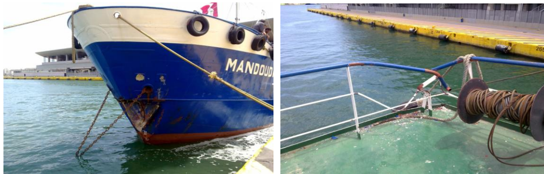
Εικόνες 2,3: Οι ζημιές οι οποίες διαπιστώθηκαν στο Δ/Ξ ΜΑΝΤΟΥΔΙ εξωτερικά (αριστερά: εμπρόσθιο τμήμα, δεξιά: χειραγωγό δεξιού καταστρώματος γέφυρας

Το Ε/Γ-Τ/Ρ υπέστη ελαφρές εκδορές στην αριστερή πλευρά του πλοίου, άνωθεν της ισάλου.