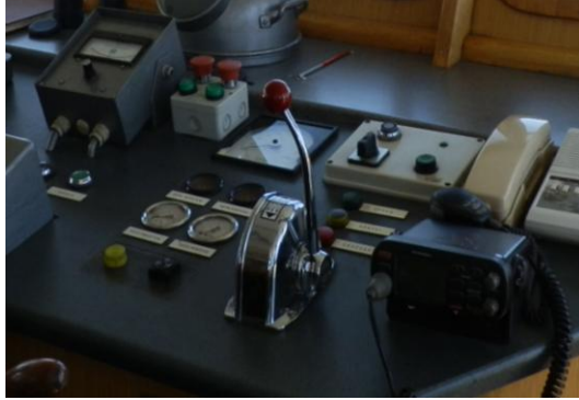
Εικόνα 4: άποψη του μοχλού ελέγχου φοράς κίνησης όπου σημειώνονται και οι ενδεικτικοί λαμπτήρες θέσης (εντός κόκκινου κύκλου)