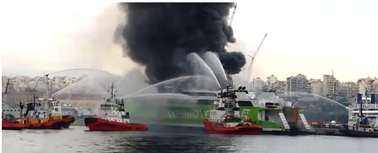
Εικόνα 1: Η κινητοποίηση των ιδιωτικών Ρ/Κ-Ν/Γ και των σκαφών της Π.Υ. για την κατάσβεση της πυρκαγιάς ήταν άμεση.

Η σχετική εντολή εγκατάλειψης δόθηκε από τον Πλοίαρχο μέσω του συστήματος μεγαφωνικής αναγγελίας. Στο μεταξύ, στην περιοχή του συμβάντος είχαν καταπλεύσει ιδιωτικά Ρ/Κ-Ν/Γ πλοία, τα οποία βρίσκονταν στην ευρύτερη περιοχή του λιμένα Πειραιά και επιχειρούσαν κάνοντας ρίψη ύδατος και αφρού πυρόσβεσης με τα μέσα που διέθεταν, από την πλευρά της θάλασσας, δηλαδή την αριστερή πλευρά του πλοίου. Συνολικά 13 ιδιωτικά Ρ/Κ-Ν/Γ σκάφη έσπευσαν στην περιοχή και ανέλαβαν δράση για την κατάσβεση της πυρκαγιάς καθώς και 02 Πυροσβεστικά πλοία του Πυροσβεστικού Σώματος. Επιπρόσθετα, εποχούμενα κλιμάκια της Πυροσβεστικής Υπηρεσίας αναπτύχθηκαν σε πολύ σύντομο χρονικό διάστημα από την πλευρά της προβλήτας, δηλαδή από τη δεξιά πλευρά του πλοίου και έκαναν ρίψη ύδατος με χρήση των αντλιών που διέθεταν τα πυροσβεστικά οχήματα και χρησιμοποιώντας την παροχή ύδατος που υπήρχε στην προβλήτα, πλησίον του πρωαίου δεξιού τμήματος του πλοίου. Τα στελέχη της Λιμενικής Αρχής Κερασινίου έσπευσαν άμεσα και απέκλεισαν την πρόσβαση στην περιοχή του συμβάντος.