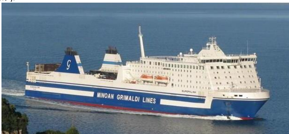
Το Ε/Γ-Ο/Γ EUROPALINK.

ακολουθήθηκε ακριβώς όπως είχε σχεδιασθεί, εξ' αιτίας της παρουσίας ενός Ιστιοφόρου σκάφους που έπλεε αριστερά πλώραθεν του EUROPALINK, που εμπόδιζε μερικώς την έγκαιρη στροφή του προς αριστερά, η οποία έλαβε χώρα μετά από το προκαθορισμένο Σημείο Ελέγχου Πορείας ("Waypoint").