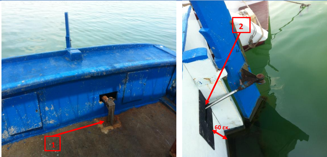
Εικόνα 2: Το σημείο έδρασης του μηχανισμού πηδαλίου (1) και το σημείο από το οποίο ο μηχανισμός διαπερνάει το περίβλημα του σκάφους καταλήγοντας στην άρμωση με το πηδάλιο (2).